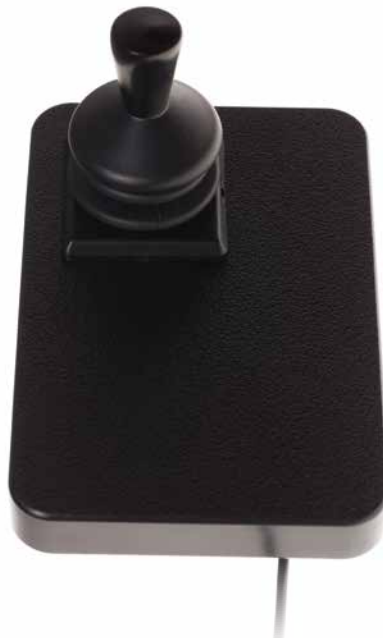
Proportionele pediatische compact