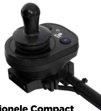
Proportionele Compact bediening