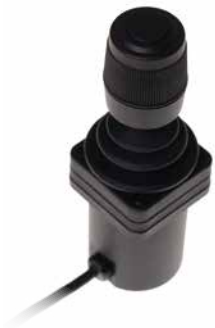
Proportionele Heavy Duty